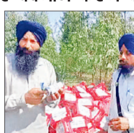
अंबाला। शंभू बॉर्डर के पास बिखरी बियर की पेटियां निकले कैद दिखाते किसान।

शंभू बॉर्डर पर डटे किसानों के पास ही कुछ लोगों ने ट्रक में लदी बियर की पेटियां फेंक दी। धरने पर बैठे किसानों की नजर सुबह ही पास बिखरी पेटियों पर पड़ी। इसके बाद पुलिस को सूचना दी गई। साथ ही पूरे मामले की जांच की मांग की गई। किसानों का आरोप है कि शराब की आड़ में उन्हें बदनाम करने का प्रयास किया जा रहा है। दरअसल पिछले 45 दिनों से किसान मांगों को लेकर