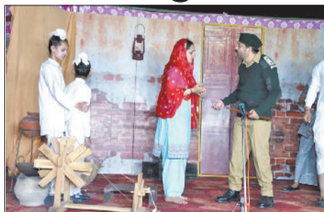
करनाल। नाटक की प्रस्तुति देते प्रतिभागी। कार्यक्रम में नाटक की प्रस्तुति से सभी मन मोहा