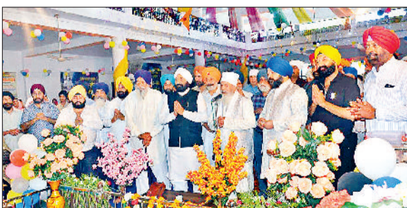
स्थापित करके सेवा और सिमरन में शामिल होने के लिए प्रेरित किया। उन्होंने बताया कि दशवं पातशाह गुरु गोबिंद सिंह महाराज ने होला महल्ला का आरंभ आनंदपुर साहिब के किला होलागढ़ से किया था और