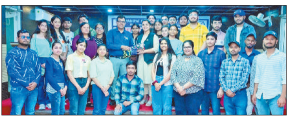
पानीपत। द इंस्टीट्यूट ऑफ चार्टर्ड अकाउंटेंट्स ऑफ इंडिया चेयर, पानीपत, सीएम के विद्यार्थियों का स्वागत करते हुए।