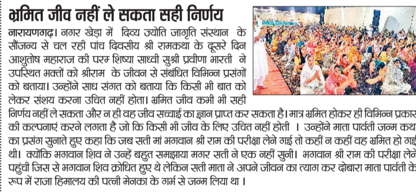
शहरादपुर। महिला चौपाल क दौरान मौजूद ग्रामीण।