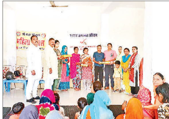
नारायणगढ़। महिला चौपाल के दौरान मौजूद महिलाएं व अन्य लोग।